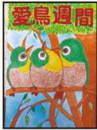
銀賞 甲斐 みつき (高巣野小6年)