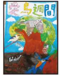
銅賞 若松 愛理 (高千穂小6年)