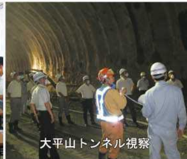
大平山トンネル視察