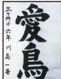
銅賞 川島 一華 (三ヶ所小6年)