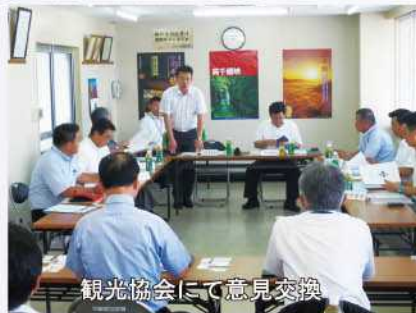
観光協会にて意見交換

現在、大平山トンネルは、東西両方向から工事が進められており、7月9日現在で、延長約2,306mのうち691mが掘削されています。