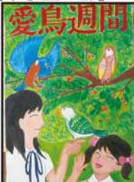
金賞 工藤 李理 (上野中2年)