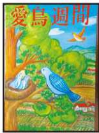
銀賞 藤井 楓 (三ヶ所中2年)