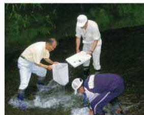
水生生物の捕捉調査(神代川)