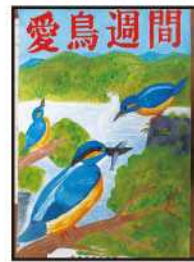
銅賞 安在 琳世 (田原中3年)