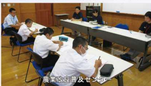
農業改良普及センター

今回の職場体験を通じて、生徒さんは、公共事業の役割や支庁の仕事などを理解してもらえたのではないかと思います。