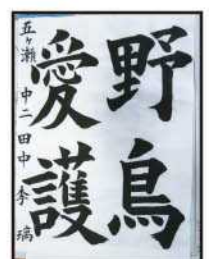
銅賞 田中 李璃 (五ヶ瀬中等2年)