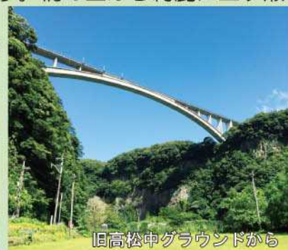
旧高松中グラウンドから

*西臼杵支庁の業務等について、ご意見、ご要望などありましたら下記までご連絡ください。