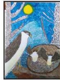
銅賞 戸高 百桃 (上組小3年)