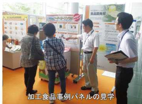
加工食品事例パネルの見学