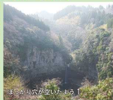
ほっかり穴が空いたよう↑

滝の落差は約20m、滝壺の大きさは5,000㎡ほどあり、写真右のように滝壺が落ち込んだような形となっています。滝の周囲は柱状節理と草木に囲まれ、エメラルド色の大きな水面という壮大な景色が現れて、まるでジャングルの世界にきてしまったかのような錯覚を覚えます！特に雨が降った次の日などは水量が多く見応えがあり、超オススメです！