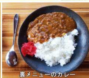
裏メニューのカレー