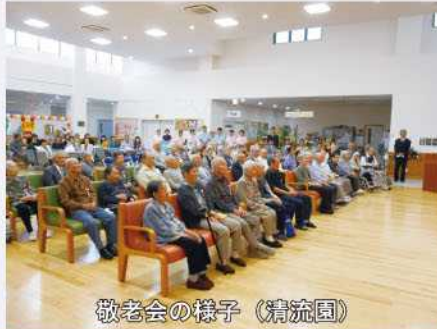
敬老会の様子(清流園)