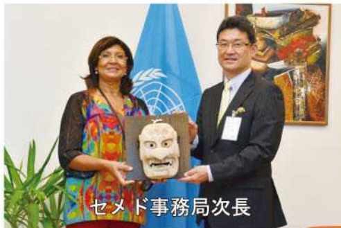
セメド事務局次長