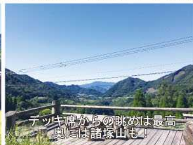
デッキ席からの眺めは最高 奥には諸塚山も！

【営業時間】11時～16時 【定休日】月曜日 【電話番号】0982-76-1450 【住所】高千穂町上岩戸573-2 ※農作業中のこともありますので、事前の電話予約をお勧めします。