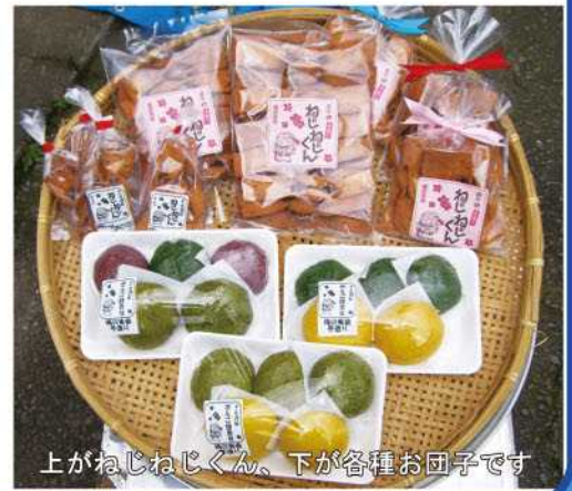
上がねじねじくん、下が各種お団子です