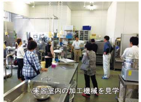
実習室内の加工機械を見学