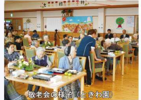
敬老会の様子(ときわ園)