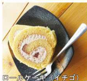
ロールケーキ（イチゴ）

【営業時間】11時～16時 【定休日】月曜日 【電話番号】0982-76-1450 【住所】高千穂町上岩戸573-2 ※農作業中のこともありますので、事前の電話予約をお勧めします。