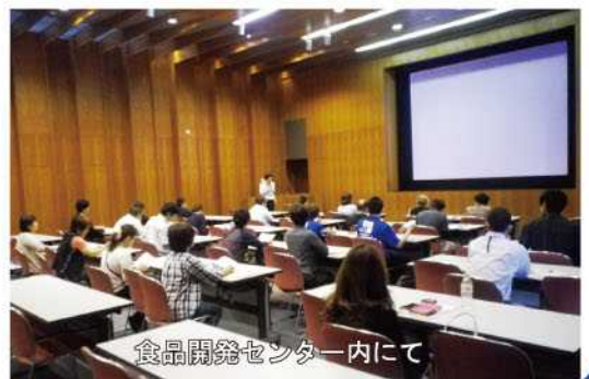
食品開発センター内にて