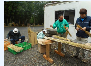
◁しめ 縄作りで大忙し!