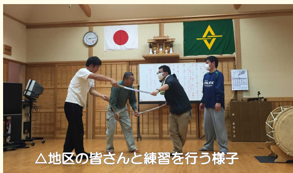
△地区の皆さんと練習を行う様子

夜神楽を奉納する地区は、町内にたくさんありますが、野方野で舞うほしやどんたちは、自分たちの地域の夜神楽が一番だという、神楽への熱い「情熱」や「誇り」を持っています。