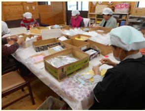
◁袋詰め の委託作業

【住所】宮崎県西臼杵郡高千穂町大字岩戸972番地1 【電話】0982-74-8070 【作業時間】9:00~16:00(土日祝は休み)