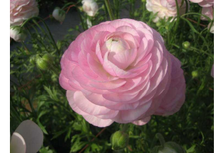
△美しいランキュラス