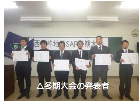
△冬期大会の発表者

最優秀賞の2名に、プロジェクト発表の2名を加えた計4名が、1月31日に開催される宮崎県SAP冬期大会に出場することになりました。西臼杵地区の代表として、彼らの更なる活躍を期待します。