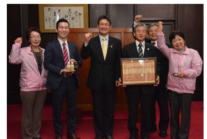
△知事への受賞報告をされました