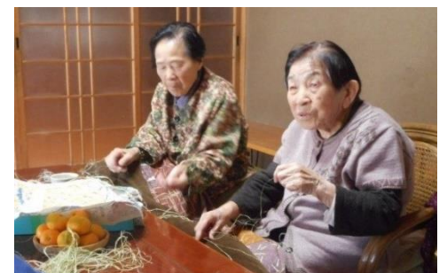
△楽しそうに糸を績んでいました！