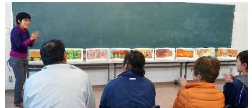
△素敵な作品ができました！