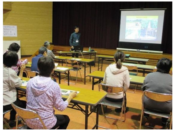
△普及センターによる研修の様子

2回目は、五ヶ瀬町SAP会議会員が育てたこんにゃく芋を使った、こんにゃく作り体験を実施しました。参加者からは、「農業の知識が深まった」「暮らしに役立つ知識が得られた」といった声が聞かれ、有意義な研修会となりました。