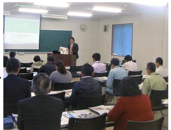
△西臼杵地域のフードビジネス振興についてアドバイスがありました！

講師からは「世界農業遺産の認定地域で作られた米」「神話の里のミネラルウォーター」など、西臼杵地域ならではのネームバリューを利用した商品開発など具体的なアドバイスも行われました。