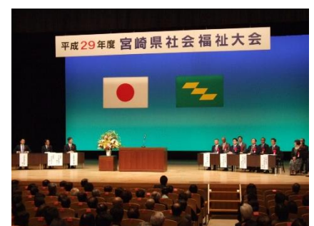
△県社会福祉大会の様子