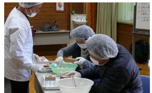
△らくがんの制作体験

訪れた方々からは「事業所の仕事に分かってよかった」との声が聞かれ、障がい福祉事業所について知ってもらう良い機会となりました。