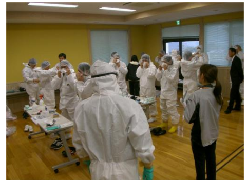
△防護服の着脱訓練

昨年、宮崎県では鳥インフルエンザが発生しました。渡り鳥の増えるこれからの時期、養鶏農家や関係機関が一丸となって、鳥インフルエンザを発生させないように予防対策にも取り組んでいきます。