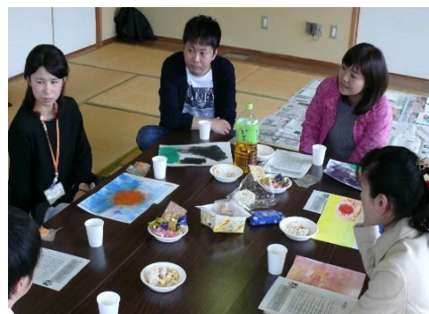
△とても和やかな雰囲気で見聞交換

今回で2回目の「つどい」の開催でしたが、これをきっかけに西臼杵郡内で働いている障がい者同士の交流がより一層、深まることが期待されます。