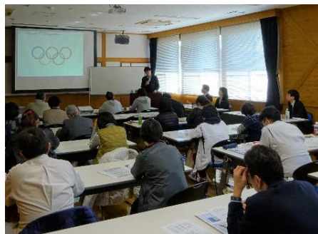
△熱心に講話を聞く受講者のみなさん

参加者からは、「販売を伸ばすために効果的な、商品のディスプレイや販売方法など情報収集が必要」といった感想が聞かれ、地域で6次化に取り組む方々にとって、商品の販売を伸ばすためのポイントや食品表示について再確認する貴重な機会となりました。