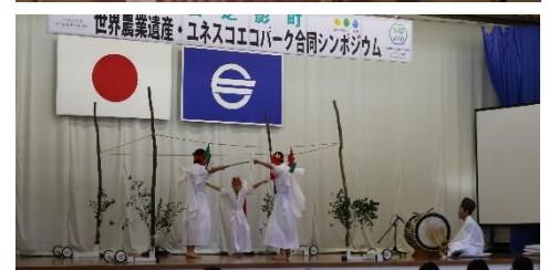
△大楠小崎神楽文化財愛護少年団による公演