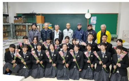
△想いを込めて花束づくり！

花に親しんでもらうとともに、地域で生産される花を知ってもらうことを目的に毎年行われ、参加した生徒は、生産者等から花束の作り方を教えてもらった後、色とりどりの花を組み合わせ、お世話になった先輩方への想いを込めつつ、花束を作っていました。