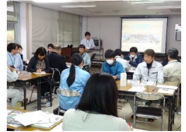
△横の連携を更に密にしていきます

日南市における「木育と子育て支援が連携した取組」について事例報告があり、その後「木育」が子育て支援の場でどのような役割を果たせるかについてワークショップを行いました。今後は管内の関係機関の連携を更に強化させ、具体的な取組に繋げていきます。