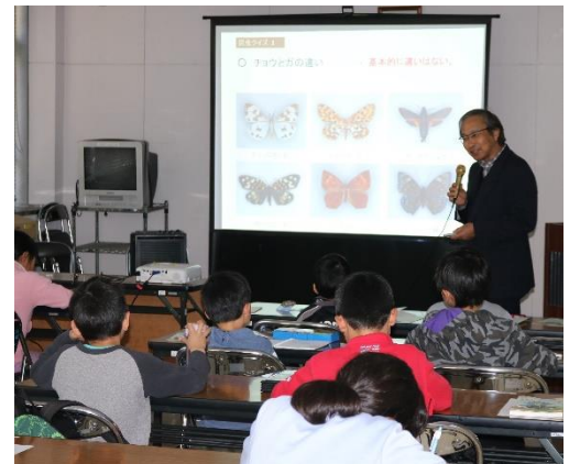
△中央公民館で行われた昆虫教室

高千穂町で発見された「イワトメクラチビゴミムシ」の話など、身近な昆虫についてのクイズなどを交えて、小学生にとっても、楽しい内容で講話が行われました。