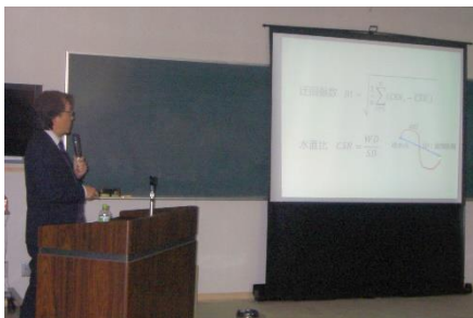
△12本の研究成果が報告されました

研究テーマは、本地域の神楽奉仕者の実態調査や、山腹用水路の特徴、世界農業遺産を活用した農村の活性化など、多岐にわたり報告されました。報告会には、県や認定5町村の職員を中心とした約40名が出席しました。