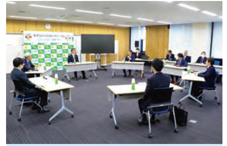
意見交換の様子 ('知事とのふれあいフォーラム'分野版) (2024年1月31日)

半導体産業は、地域経済の活性化や雇用の創出など地域振興が期待される産業です。県は、これからも半導体産業の発展を支援していきます。