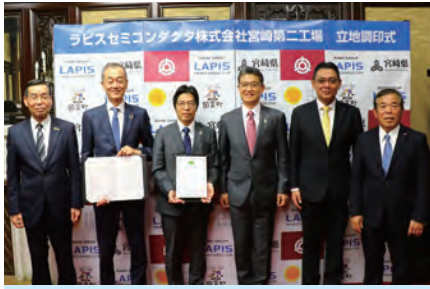
ラピスセミコンダクタ株式会社 宮崎第二工場 立地調印式(2023年12月21日)

半導体製品の製造会社ラピスセミコンダクタ株式会社の宮崎第二工場が国富町に立地することになり、昨年12月に県と町と同社の3者は、工場の整備・運営を円滑に進めるために、立地協定を締結しました。