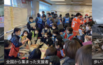
全国から集まった支援者