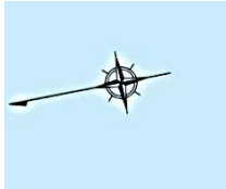
図1 物件番号 1 位置図