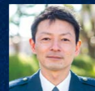
警察署 地域課 警部補

地域警察は、住民の方にとって一番身近な存在であり、地域に貢献できることを最も肌で感じることができる部門です。一方で、警察組織の最前線として110番通報などの事案に真っ先に対応する重要な役割も担っています。時には厳しい場面に遭遇することもあります。1人に対応することはありません。必ず同僚や先輩、上司が力を貸してくれます。最初は慣れない業務もあるでしょうが、みんなで力を合わせて、安全・安心な宮崎を守りましょう。