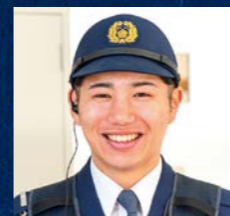
警察署 地域課 巡査

勤務時間は午前8時30分から翌日午前8時30分までの24時間制勤務(休憩・仮眠時間を含む)です。次の当番員と交替して、非番は残務処理を終えると帰宅できます。翌日は休日となります。