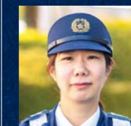
警察署 地域課 巡査長

地域警察は、住民の方にとって一番身近な存在であり、地域に貢献できることを最も肌で感じることができる部門です。一方で、警察組織の最前線として110番通報などの事案に真っ先に対応する重要な役割も担っています。時には厳しい場面に遭遇することもあります。1人に対応することはありません。必ず同僚や先輩、上司が力を貸してくれます。最初は慣れない業務もあるでしょうが、みんなで力を合わせて、安全・安心な宮崎を守りましょう。