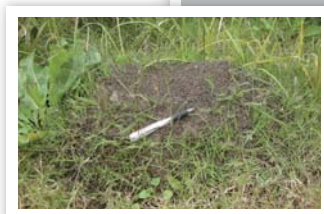
ヒアリが作る大きなアリ塚