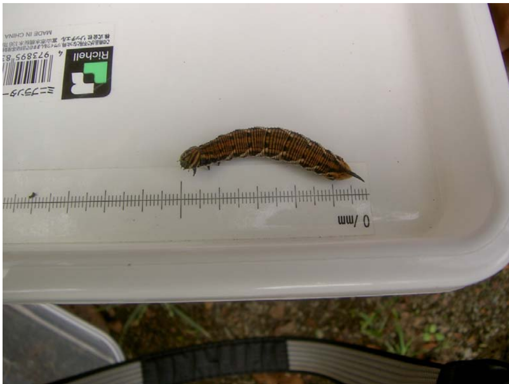
シジミチョウの幼虫