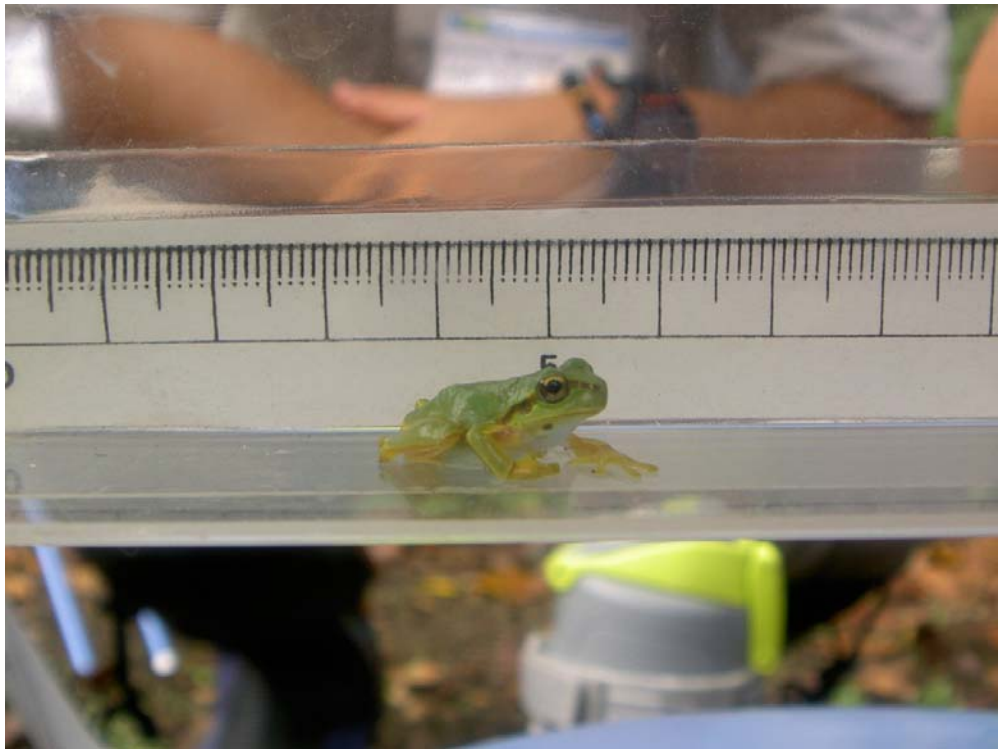
ニホンアマガエル