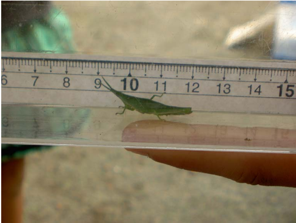
ショウリョウバッタ