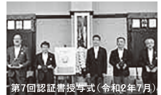
第7回認証書授与式(令和2年7月)

※申請書については、随時受け付けています。なお、申請から認証まで3か月程度かかります。認証の有効期間は3年間です。